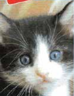
Einfach putzig Mythos Katze

Das Lifestyle Magazin für das Fünf-Seen-Land