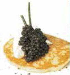
Einfach lecker Alles über Kaviar